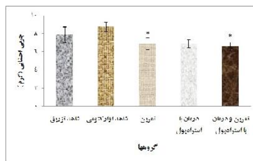
شکل ۳. میانگین وزن چربی احشایی در گروه‌های مختلف پس از هشت هفته

* تفاوت آماری در مقایسه با گروه شاهد اوارکتومی ( p < 0.05 ) † تفاوت آماری در مقایسه با گروه شاهد تزریق ( p < 0.05 )