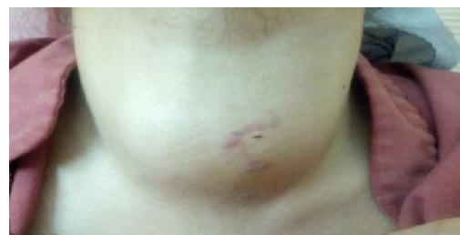
شکل ۱. بزرگی غده تیروئید در ناحیه گردن

در سونوگرافی از هر دو پستان، تجمع متعدد در هر ۴ ربع پستان به ابعاد ۱۵×۱۵ و با فاصله حدود ۵-۶ سانتیمتر از پوست مشاهده شد که هایپرپلازی داکتال و یا نکروز غیر لنفاوی پستان مطرح شد. بررسی با سی تی اسکن توراکس نرمال گزارش شد و لنفادنوپاتی رویت نگردید. در ناحیه گردن، غده تیروئید بسیار بزرگ به ابعاد ۴۹×۶۸×۹۱ میلی‌متر با اثر فشاری بر تراشه گزارش گردید که با توجه به هموژن بودن تیروئید احتمال بیماری‌های انفیلتراتیویا تیروئیدیت مطرح شد. در بررسی اکوکاردیوگرافی قلب نرمال گزارش گردید.