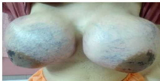
شکل ۲. بزرگی هر دو پستان و تلانژکتازی متعدد در پوست پستان

در سونوگرافی از هر دو پستان، تجمع متعدد در هر ۴ ربع پستان به ابعاد ۱۵×۱۵ و با فاصله حدود ۵-۶ سانتیمتر از پوست مشاهده شد که هایپرپلازی داکتال و یا نکروز غیر لنفاوی پستان مطرح شد. بررسی با سی تی اسکن توراکس نرمال گزارش شد و لنفادنوپاتی رویت نگردید. در ناحیه گردن، غده تیروئید بسیار بزرگ به ابعاد ۴۹×۶۸×۹۱ میلی‌متر با اثر فشاری بر تراشه گزارش گردید که با توجه به هموژن بودن تیروئید احتمال بیماری‌های انفیلتراتیویا تیروئیدیت مطرح شد. در بررسی اکوکاردیوگرافی قلب نرمال گزارش گردید.