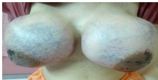
شکل ۲. بزرگی هر دو پستان و تلانژکتازی متعدد در پوست پستان

بررسی با سی تی اسکن توراکس نرمال گزارش شد و لنفادنوپاتی رویت نگردید. در ناحیه گردن، غده تیروئید بسیار بزرگ به ابعاد ۴۹×۶۸×۹۱ میلی‌متر با اثر فشاری بر تراشه گزارش گردید که با توجه به هموژن بودن تیروئید احتمال بیماری‌های انفیلتراتیویا تیروئیدیت مطرح شد. در بررسی اکوکاردیوگرافی قلب نرمال گزارش گردید.