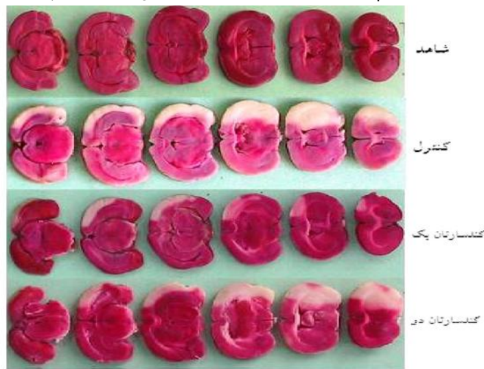
شکل ۳. حجم ضایعه مغزی در حیوانات گروه ایسکمیک و گروههای درمان شده با کندسارتان: کندسارتان یک (0.1mg/kg) و کندسارتان دو (0.5mg/kg) ۲۴ ساعت پس از وقوع ایسکمیک مغزی (* نسبت به گروه کنترل P < 0/05 , ** نسبت به گروه کنترل P < 0/01 ).