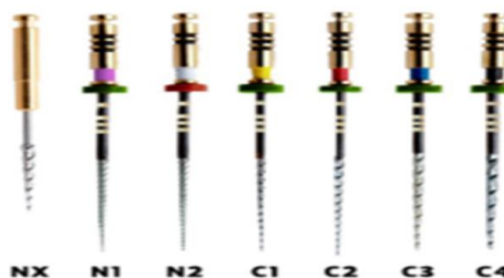
شکل ۱. فایل Smart tract X3

[۳-۵]. در سال‌های اخیر بهبود خواص ترمومکانیکی آلیاژهای Ni-Ti برای رفع این محدودیت‌ها از طریق عملیات حرارتی، پولیش الکتریکی و ماشین کاری تخلیه الکتریکی توجه زیادی را به خود جلب کرده است [۶]. هدف از عملیات حرارتی انتقال فاز مارتنزیتی بیشتر به فایل‌ها در دمای معمولی بدن برای به دست آوردن حداکثر مزیت انعطاف‌پذیری در مقایسه با فاز آستنیتی و همچنین بهبود مقاومت در برابر خستگی چرخه‌ای در مقایسه با آلیاژهای Ni-Ti معمولی است [۷]. Smart Tract X3 (تصویر ۱)، یک سیستم فایل چرخشی جدید اصلاح شده با حرارت است که شامل یک فایل Nx (۱۲/۲۵٪) برای شکل‌دهی دهانه کانال، و شش عدد فایل برای پاکسازی کانال می‌باشد (N1: ۱۷/۶٪، N2: ۱۷/۴٪، C1: ۲۰/۶٪، C2: ۲۵/۶٪، C3: ۳۰/۶٪، C4: ۴۰/۶٪) و ادعا می‌شود مقاومت بالایی در برابر شکستگی در کانال‌های ریشه انحنادار دارد. با توجه به عدم انجام مطالعات در مورد فایل Smart Tract X3 در مقایسه با سیستم فایل‌های چرخشی آلیاژهای Ni-Ti که به طور معمول استفاده می‌شود، مطالعه حاضر با هدف بررسی میزان شکست، محل شکست، طول و فاصله قطعات شکسته شده Smart Tract X3 از راس بلوک در مقایسه با سیستم فایل‌های چرخشی Neoniti و ProTaper در کانال‌های ریشه با انحنای شدید انجام شد.