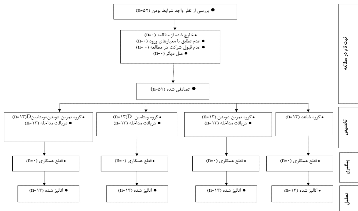
شکل ۱. فلوچارت آزمودنی‌های تحقیق