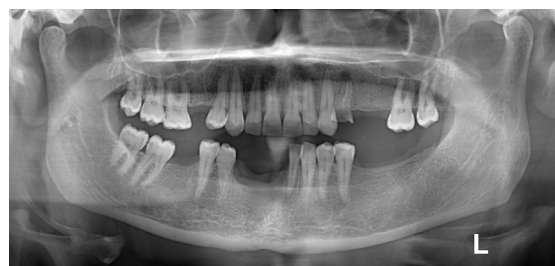
شکل ۵. نمای رادیوگرافی پس از شش ماه