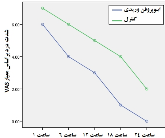
نمودار ۱. مقایسه میانگین شدت درد در دو گروه ایبوپروفن وریدی و کنترل

میانگین شدت درد در دو گروه ایبوپروفن وریدی و کنترل در زمان‌های مختلف اندازه‌گیری شد (نمودار ۱).