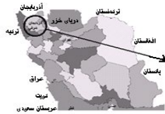
موقعیت استان آذربایجان شرقی