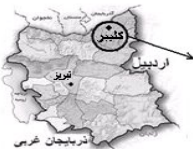
نقشه استان آذربایجان شرقی