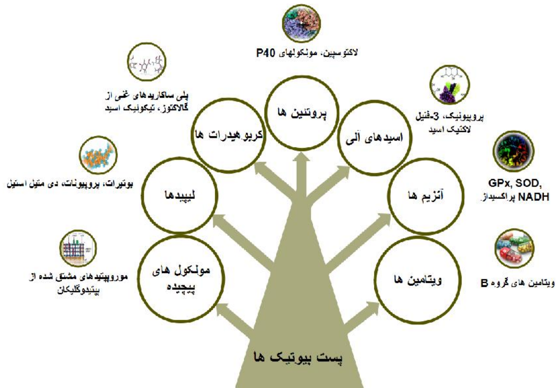
شکل ۱. انواع پست‌بیوتیک‌ها بر اساس نوع و ترکیب شیمیایی