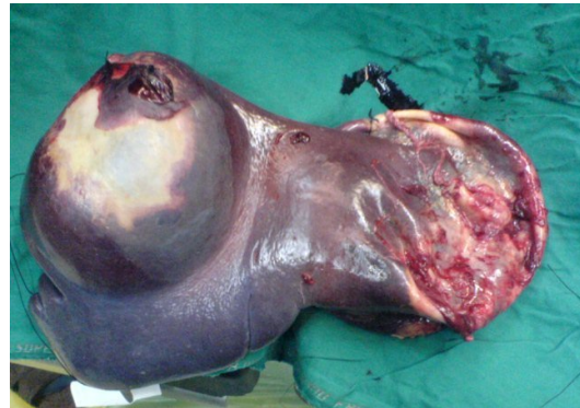
شکل ۲. عکس پس از عمل از کیست در داخل طحال

سه روز با حال عمومی خوب و تجویز دارو از بیمارستان مرخص شد.