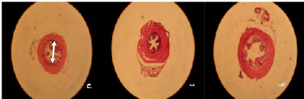
شکل ۲. تصاویر نشان دهنده نمای مجاری دفران با میکروسکوپ نوری در گروه های مختلف می باشند. الف: گروه کنترل که، قطر طبیعی مجرای دفران را نشان می دهد (پیکان). ب: گروه تحت استرس کم یک ماهه به کاهش قابل توجه قطر مجرای دفران دقت کنید (پیکان). ج: گروه تحت استرس زیاد دو ماهه کاهش قطر مجرای دفران مشاهده میشود (پیکان) (بزرگنمایی ۱۰).