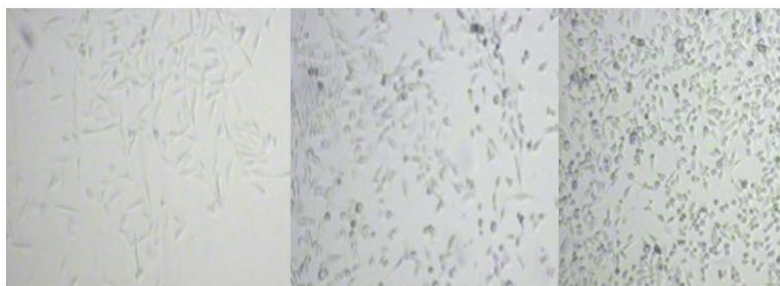
شکل ۱. تصاویر کشت MTT سل لاین PC 3 به ترتیب از چپ به راست: کنترل، ۱ppm عصاره قره‌قات و 600 ppm عصاره قره‌قات