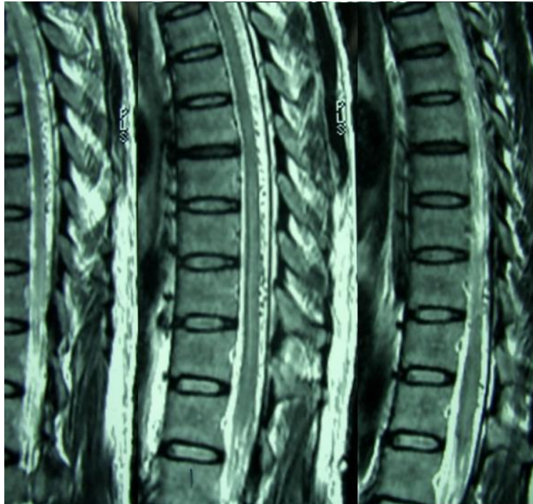
شکل ۱. SDAVF (Spinal Dural Arteriovenous Fistula) در نمای توراسیک

دورسال نخاع از T3 تا کونوس مدولاریس و کودال تا کانال نخاعی کمری وجود داشت. با ماده حاجب موارد ذکر شده افزایش جذب داشت. جهت بیمار آنژیوگرافی قراردادی ۲ انجام شد که DAVF type 1 تایید شد و بیمار جهت عمل جراحی و تصمیم برای انتخاب روش درمان به جراح مغز و اعصاب ارجاع داده شد.