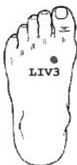
شکل ۲. نقطه تای چانگ

لذا با توجه به اهمیت دیسمنوره و کنترل آن در جامعه و پیشرفت علم در رابطه با طب مکمل، پژوهشگر تصمیم به انجام این تحقیق با عنوان مقایسه تاثیر طب فشاری در دو نقطه سانینجیائو و تای چانگ بر دیسمنوره اولیه گرفته است.