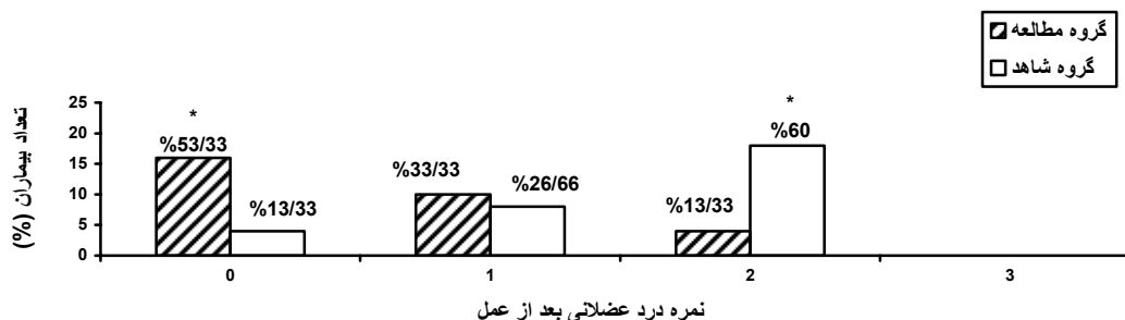
شکل ۲. شیوع و شدت میالژی بعد از عمل در بیماران دو گروه مطالعه p < ۰/۰۰۰۱ *