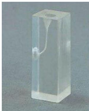
شکل ۲. نمونه بلوک رزینی

در گروه Smart Tract X3 بعد از بررسی مسیر با k فایل دستی شماره ۱۵ (Mani, Tochigi, Japan) و تعیین طول کانال ابتدا فایل N1 (سایز ۱۷/۶٪) و N2 (سایز ۱۷/۴٪) با حرکت Brushing در ۲/۳ کرونال کانال استفاده شد، سپس Nx (سایز ۱۲/۲۵٪) برای شکل‌دهی دهانه کانال به کار برده شد و آماده‌سازی کانال با فایل C1 (سایز ۲۰/۶٪) و C2 (سایز ۲۵/۶٪) کامل شد. سرعت دستگاه روتاری (NSK, Nakanishi, Japan) برای تمامی این فایل‌ها ۳۰۰ دور بر دقیقه و میزان تورک ۳Ncm بود.