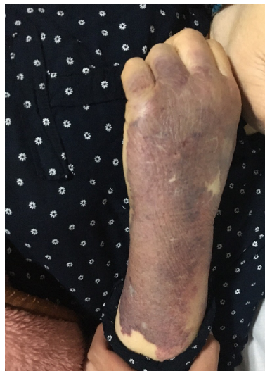
شکل ۱. ساعد بیمار که در محل اخذ نمونه خون دچار اکیموز شده است.

به مرور زمان اکیموز ساعد بیمار گسترش یافت و یک نوبت حمله تشنج با حرکات تونیک کلونیک و خروج کف از دهان با فاز پست ایکتال طولانی و کاهش سطح هوشیاری در حد GCS ۱۲ به وقوع پیوست. برای بیمار مشاوره‌های نفرولوژی، هماتولوژی و عفونی انجام گردید. با توجه به ترومبوسیتوپنی، آنمی، واقعه نورولوژیک، تب و نارسایی حاد کلیه برای TTP مطرح گردید. جهت تایید تشخیص نمونه خون از نظر ADAMTS13 ارسال شد و لام خون محیطی (PBS) بیمار بررسی گردید (شکل ۲).