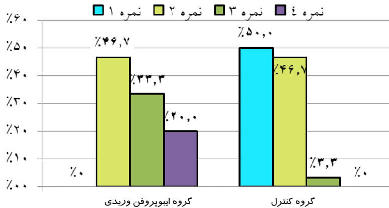
نمودار ۳. فراوانی بیماران در دو گروه ایبوپروفن وریدی و کنترل براساس نمره داده شده به رضایت از روش بی‌دردی

به منظور بررسی رضایت بیماران از روش بی‌دردی از آنها خواسته شد که به روش بی‌دردی خود نمره‌ای از ۱ (کمترین رضایت) تا ۴ (بیشترین رضایت) اختصاص بدهند که میانگین میزان رضایت بیماران در گروه