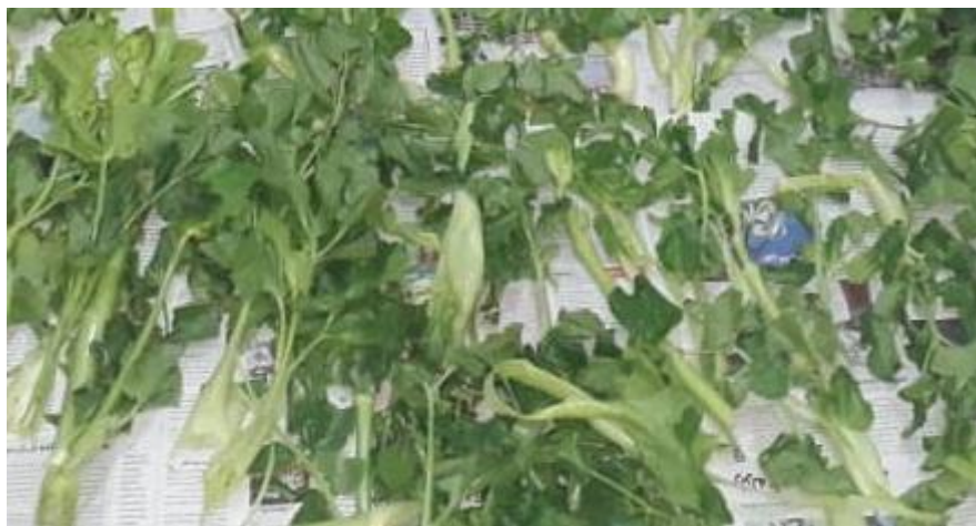
شکل ۱. گیاه آوندول

پس از تهیه نمونه‌های گیاهی آوندول، این نمونه‌ها در سایه برای مدت سه روز خشک شدند. گیاهان خشک‌شده، در آسیاب به شکل پودر درآمدند. پودر گیاه به میزان ۱۰ گرم به ۱۰۰ میلی‌لیتر اتانول ۵۰ درصد اضافه شد. نمونه پودر گیاهی همراه با الکل برای مدت یک هفته در دمای محیط همزده شد. در ادامه محلول گیاه و الکل سانتریفیوژ شد و مایع رویی