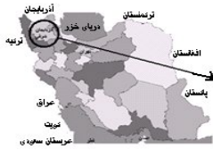
موقعیت استان آذربایجان شرقی