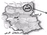
نقشه استان آذربایجان شرقی