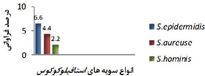
نمودار ۱. توزیع درصد فراوانی سویه های مختلف استافیلوکوکوس به تفکیک جنس و گونه در نمونه های مورد مطالعه (بیمارستان شهید افشاری پور کرمان - مهر ۹۵ تا بهمن ۹۵)