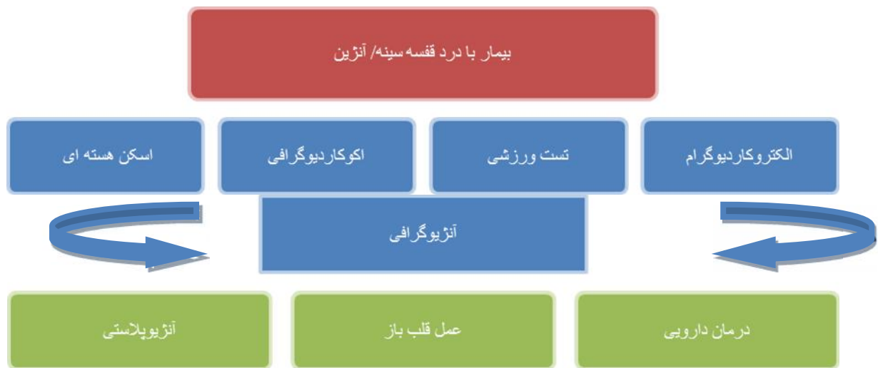
شکل ۱. فرآیند تشخیص و درمان بیماری عروق کرونر قلب [۳۰]