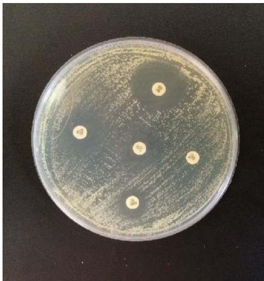
شکل ۲. آنتی بیوگرام کاندیدا با استفاده از پنج دیسک نیستاتین، کلوتریمازول، آمفوتریسین ب، فلوکونازول و کتوکونازول

بدون در نظر گرفتن گونه کاندیدا، الگوی مقاومتی بدست آمده از آنتی بیوگرام (شکل ۲) به شرح زیر بود: بیشترین مقاومت دارویی (۸۱/۱٪) و کمترین حساسیت (۱۸/۲٪) نسبت به فلوکونازول مشاهده شد. در درجات بعدی مقاومت به ترتیب کتوکونازول با ۶۹/۹٪، کلوتریمازول با ۴۶/۹٪، امفوتریسین ب با ۱۷/۵٪ و نیستاتین با ۱۶/۱٪ قرار داشتند. نیستاتین دارای کمترین مقاومت دارویی (۱۶/۱٪) و بیشترین حساسیت (۸۲/۵٪) بین داروهای مورد بررسی بود (جدول ۳).