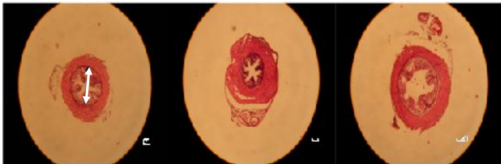
شکل ۲. تصاویر نشان دهنده نمای مجاری دفران با میکروسکوپ نوری در گروه های مختلف می باشند. الف: گروه کنترل که، قطر طبیعی مجرای دفران را نشان می دهد (پیکان). ب: گروه تحت استرس کم یک ماهه به کاهش قابل توجه قطر مجرای دفران دقت کنید (پیکان). ج: گروه تحت استرس زیاد دو ماهه کاهش قطر مجرای دفران مشاهده میشود (پیکان) (بزرگنمایی ۱۰).